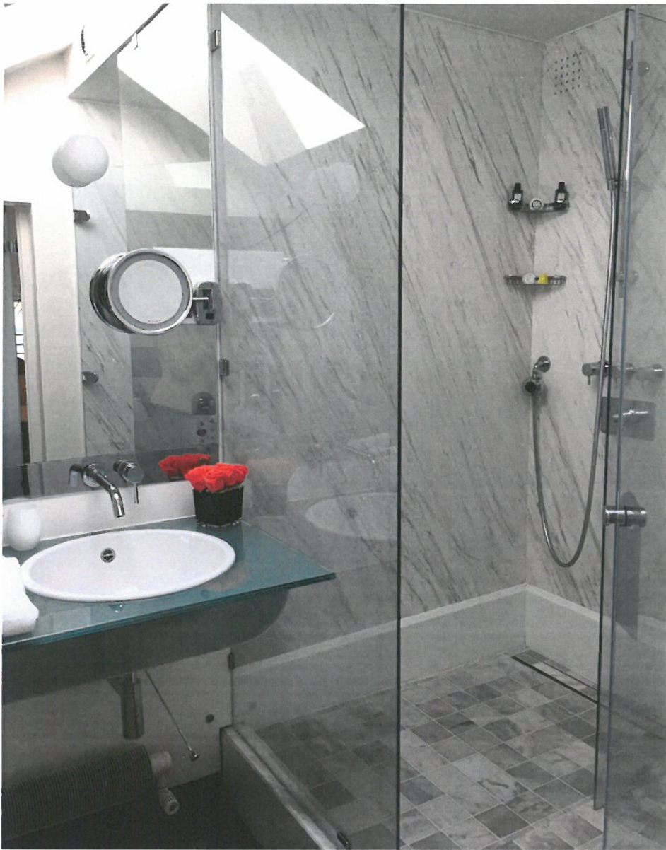
Visite de la suite Jacuzzi