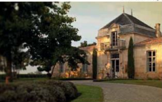
Château Cordellan Bages

Château Pape Clément : à Pessac, aux portes de Bordeaux, ce domaine de 60 ha de vignobles (grand cru classé de Graves,) autre propriété de Bernard Magrez de style néogothique, compte parmi les incontournables; à ses jardins soignés que peuplent des oliviers centenaires s'ajoutent des salles et salons prestigieux : le Pavillon du Prélat, verrière signée Gustave Eiffel au cœur du domaine (35 à 85 personnes en réunion, 70 en dîner ou 90 en cocktail), la salle de l'Orangerie (150 convives en dîner, jusqu'à 200 en cocktail), 4 salons au château, plus intimistes (45 m 2 chacun), la salle des Chais et la salle du Cuvier pour une atmosphère authentique (de 180 à 250 invités).