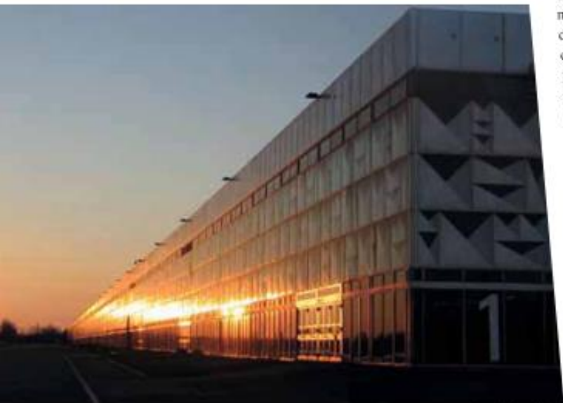
Parc des Expositions