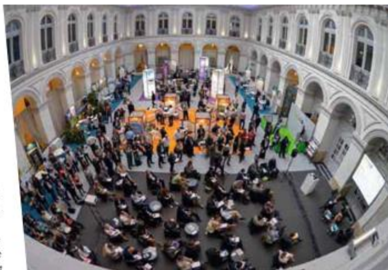
Bordeaux Palais de la Bourse