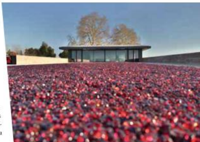
La Terrasse Rouge du Château La Dominique

La Terrasse Rouge du Château La Dominique : ouverte en avril 2014 au cœur des vignobles de Saint-Émilion, cette table (100 places assises, jusqu'à 150 en cocktail), dernière-née du groupe Nicolas Lascombes, doit son nom au matériau utilisé pour la confection de sa terrasse, vague de rubis sur le vert des ceps.