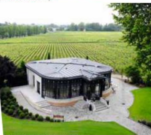
Le Pavillon du Prêlat, Château Pape Clément

Château du Tertre : à 30 mn de Bordeaux-Lac, ce « petit frère » du château Giscours, un classique des réceptions haut de gamme jusqu'à 80 convives ; Orangerie en pré-soirée (30 personnes), salle au pied des vignes et sur cour (80 personnes en dîner), chais privatisables hors saison de travail (280 personnes) et possibilité de cocktail itinérant incluant les chais (150 personnes), salle de dégustation et salon fumeur ; la demeure du début XVIII ème siècle compte aussi 5 chambres d'hôtes dignes d'un grand hôtel !