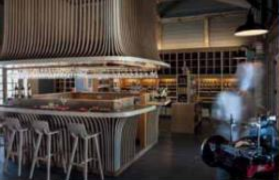
Les Sources de Caudalie