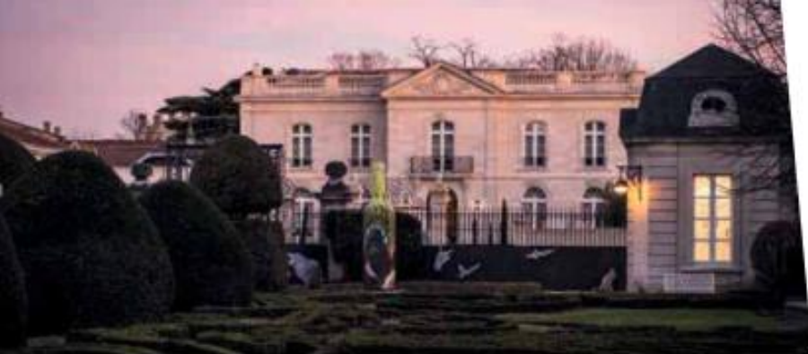
Institut Culturel Bernard Magrez

Institut Culturel Bernard Magrez : initiative privée de mécénat artistique sous l'égide de la fondation Bernard Magrez, cet institut occupe le château Labottière, vaste et belle demeure bâtie en 1775, ceinturée d'un jardin à la française. Classé monument historique, ce sublime écrin en cœur de ville met à disposition son hall d'entrée (50 personnes en cocktail), 4 salons au rez-de-chaussée (30 à 60 personnes assises, jusqu'à 150-200 sur l'ensemble) et son orangerie, pavillon