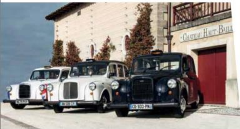
Cabs anglais par Bordeaux Event