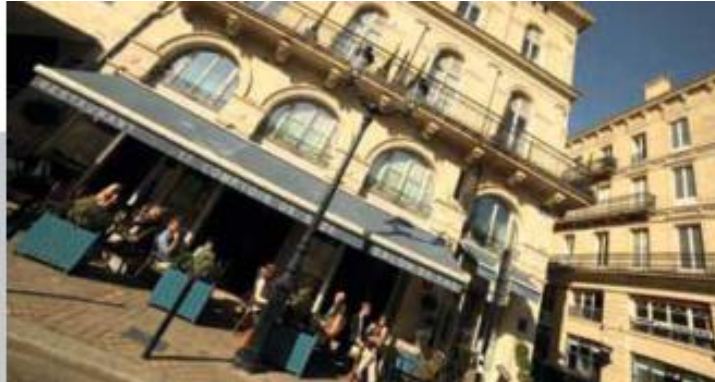
Hôtel de Sèze

Seeko'O Hôtel**** (45 chambres): face aux quais, à la croisée du Bordeaux historique et du Bordeaux en devenir, cet établissement dont le nom signifie « iceberg » en Inuit est un précurseur en matière de construction :