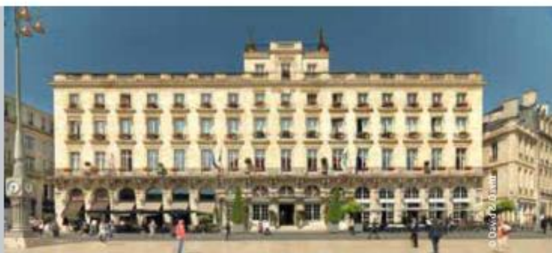
Grand Hôtel de Bordeaux &amp; Spa

L'agglomération compte 150 hôtels pour plus de 10 000 chambres, dont 6300 en centre ville (1800 en 4 et 5 étoiles) et devrait voir son pôle hôtelier s'accroître encore grâce à des projets accompagnant sa restructuration urbaine : RadissonBlu**** de 125 chambres avec espace balnéo de 1400 m 2 et espace réunion, prévu au 2 ème trimestre 2017 dans le quartier des Bassins à Flot, tout comme le projet d'un BMA de 150 chambres élaboré autour du projet Euratlantique, 3 établissements 4 étoiles sont actés, un de 50 chambres en 2016 et deux autres de 100 et 150 chambres en 2017. En attendant, trois grandes zones – Mérignac (2216 chambres), Mériadeck (1346 chambres) et Bordeaux Lac (1400 chambres) – concentrent les hôtels de chaîne, tandis que les quartiers du centre ville voient se multiplier les hôtels « concept » à l'image du Seeko'O Hôtel qui a ouvert la voie avec son design futuriste ou le très récent Mama Shelter, griffé Starck.