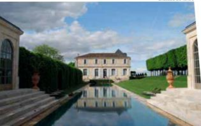
Château du Tertre

des vendanges, de la taille, du tri, etc.